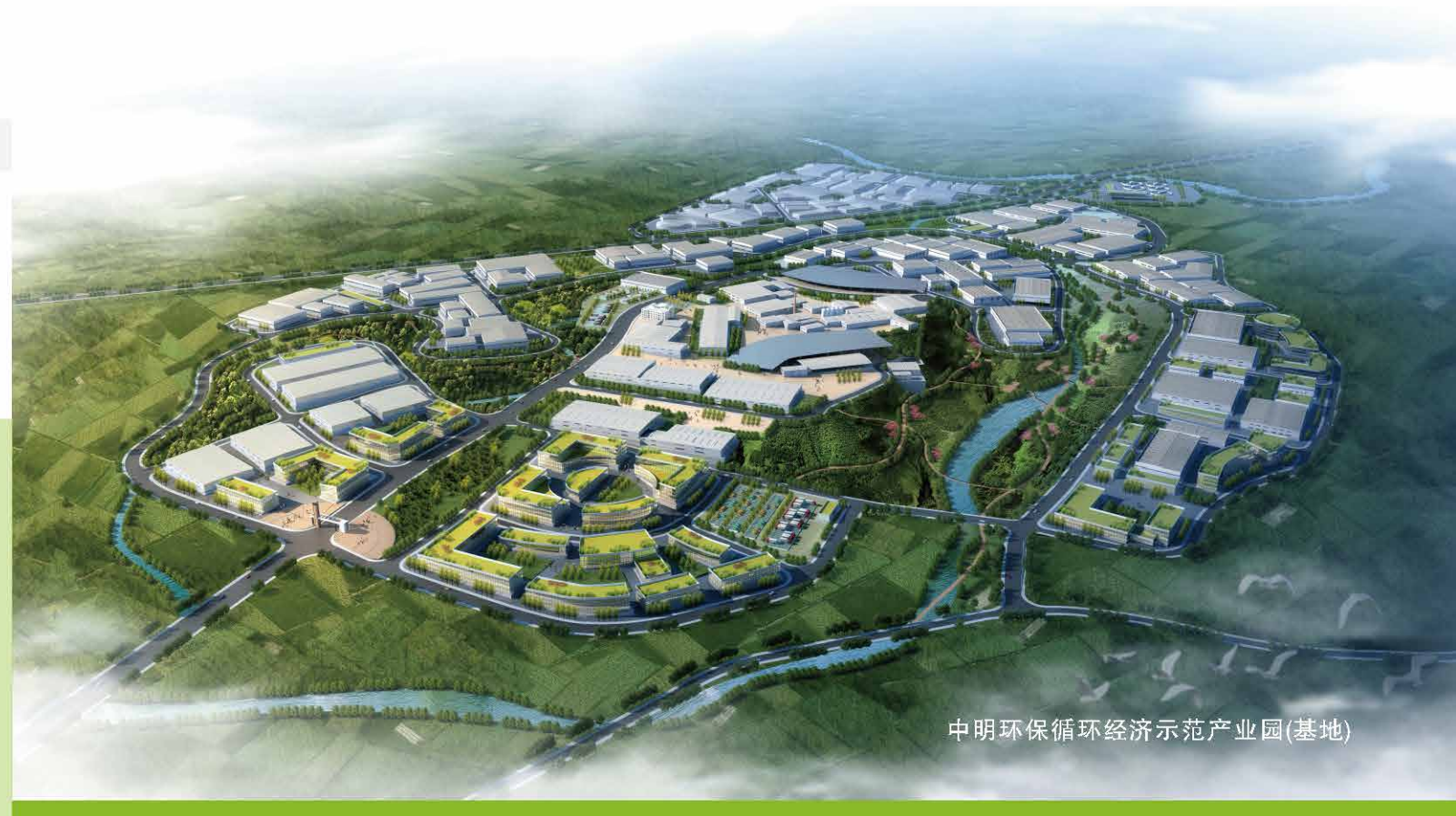
中明环保循环经济示范产业园(基地)