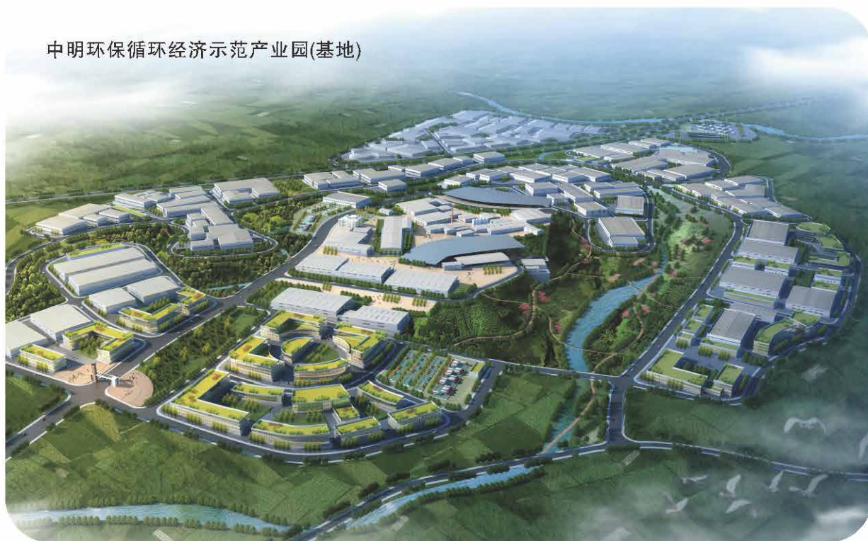
中明环保循环经济示范产业园(基地)